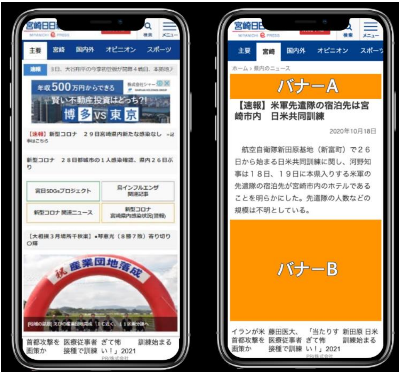
モバイルニュースページ

2021年4月からモバイルサイトが充実します。モバイルトップページ、ニュースページにより目立つ広告枠を新設。PCサイトとの連動で、ネットユーザーの接触率をアップさせます。その場合のセット料金もあります。ご相談ください。